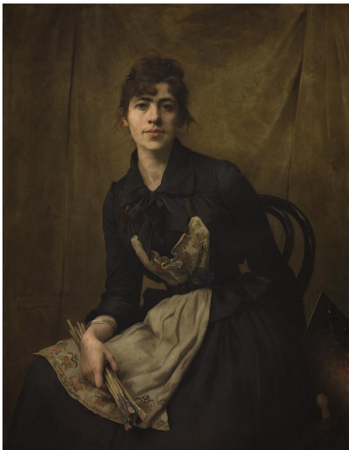
Autoportret z paletą, Anna Bilińska-Bohdanowiczowa, 1887 olej, płótno, 117 x 90 cm

Autoportret to portret artysty stworzony przez niego osobiście. Bilińska sportretowała swoją postać siedzącą na krześle, pewną siebie, ze wzrokiem utkwionym w widza. W prawej dłoni trzyma pędzle, w lewej paletę malarską. Ubrana jest w czarną suknię oraz brudny fartuch. W tle znajduje się brunatno brązowa kotara. Możemy odnieść wrażenie, że autorka właśnie skończyła pracę nad dziełem.