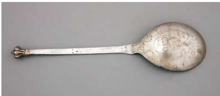
3. Łyżka z monogramem IAD