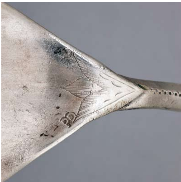
10. Znak złotniczy z łyżki z motywem kwiatowym