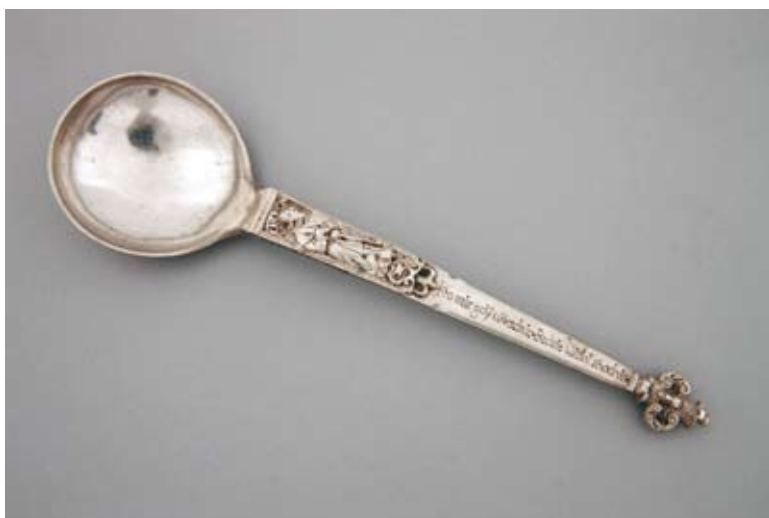
4. Łyżka z przedstawieniem św. Bartłomieja