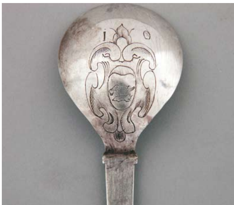
2. Czerpak łyżki z herbem „Korwin”