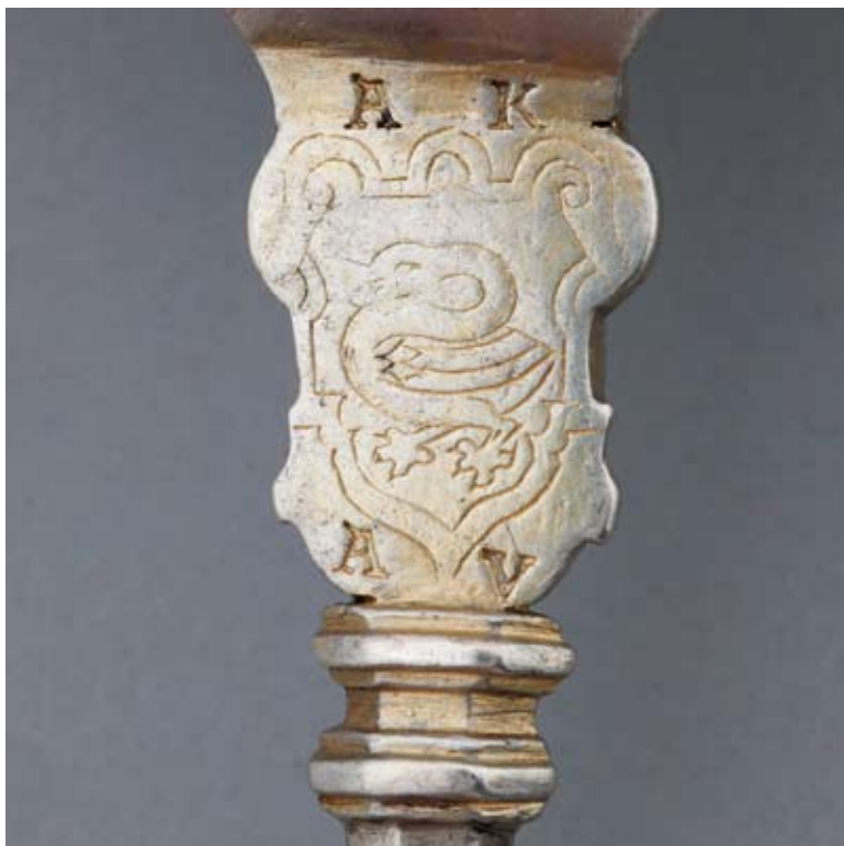
8. Rewers nartu łyżki z herbem „Łabędź”