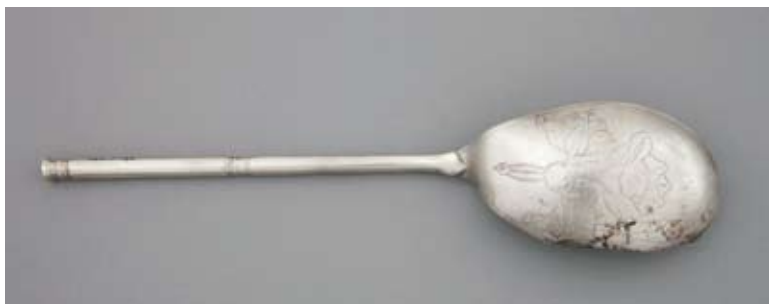
9. Łyżka z motywem kwiatowym