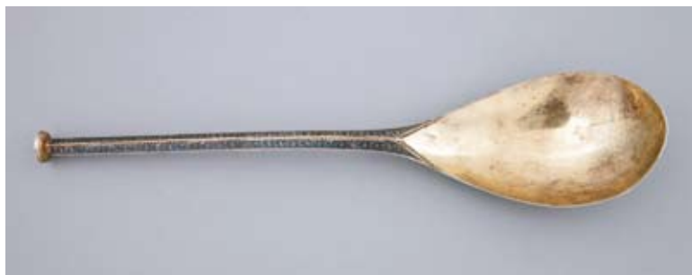
11. Łyżka z herbem „Leliwa”