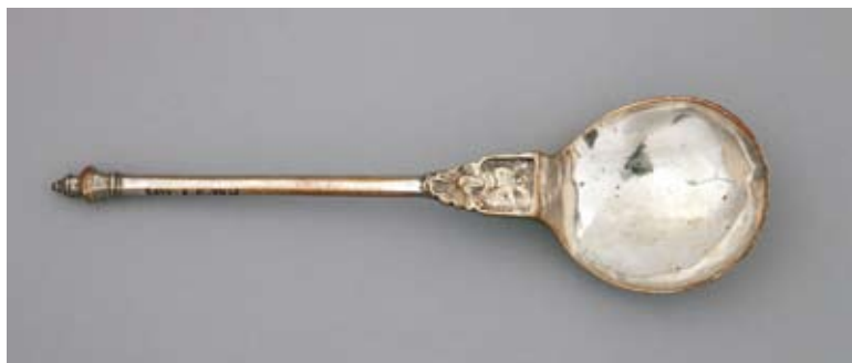
6. Łyżka z przedstawieniem anioła