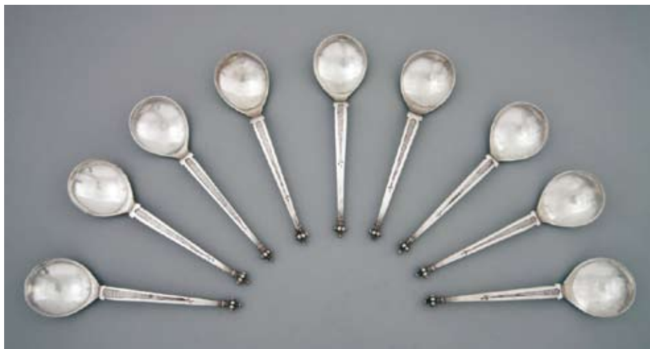
1. Komplet łyżek z herbem „Korwin”*