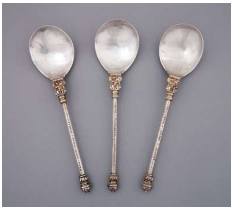
7. Trzy łyżki z herbem „Łabędź”