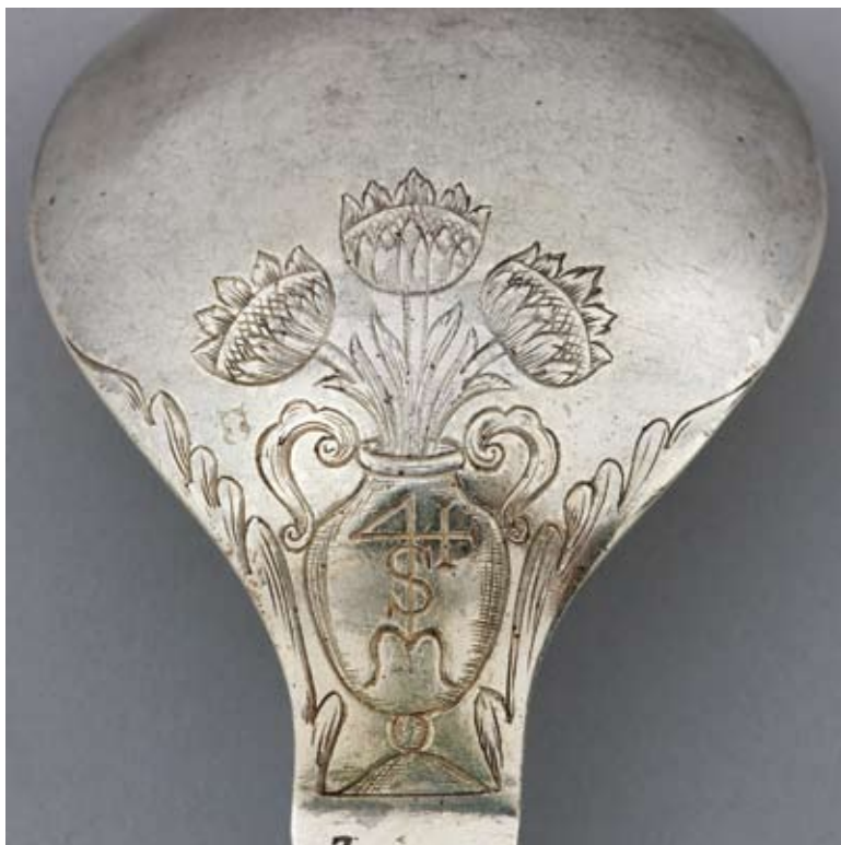
16. Czerpak łyżki z przedstawieniem zodiakalnych Ryb