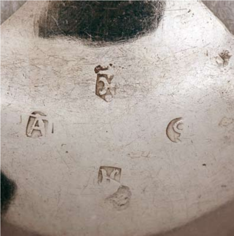
14. Znaki zlotnicze z łyżki z przedstawieniem św. Mateusza