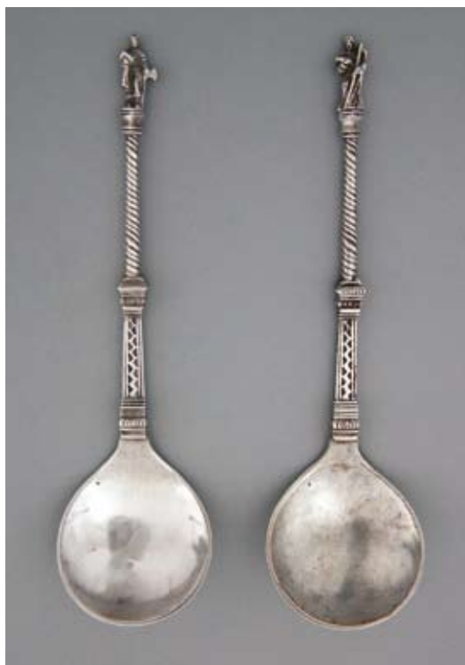
13. Dwie łyżki z przedstawieniami świętych: Jakuba Młodszego i Mateusza