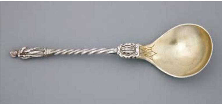
15. Łyżka z przedstawieniem zodiakalnych Ryb